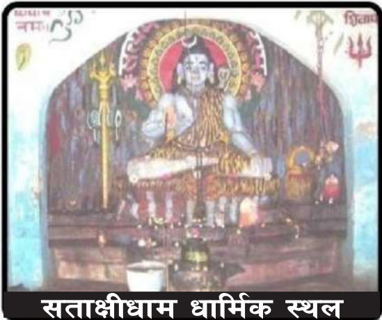
सताक्षीधाम धार्मिक स्थल

यति हुँदा हुँदै पनि नगरपालिकाको आन्तरिक स्रोतमा कमिले गर्दा नगरपालिकाको सर्वाङ्ग विकासमा सफलता हासिल गर्न चुनौती तथा समस्या रहेको छ। सुकुम्वासी समस्या, वेरोजगारी, वसाई सराई, खुला सिमाना, हात्ती आतंक, स्थानीय आदिवासी जनजाति माथि अतिक्रमण तथा संस्कृति लोप, युवा युवतीहरू लागु औषध दुर्व्यसनी र एच. आई. बी. सक्रमितको बढ्दो प्रकोप, चेली वेटी बेचबिखन, उद्योग धन्दा नहुनु समस्याको रूपमा लिन सकिन्छ। दुई ठूला नदीहरू कन्काई र कमलको बीचमा रहेको यस नगरपालिका तथा धेरै संख्यामा रहेका साना नदी तथा खोलाहरूको समुचित व्यवस्थापन ठूलो समस्या र चुनौतीको रूपमा रहेको छ।