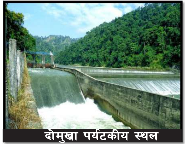
दोमुखा पर्यटकीय स्थल